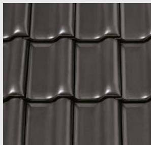
NUANCE altgrau engobiert