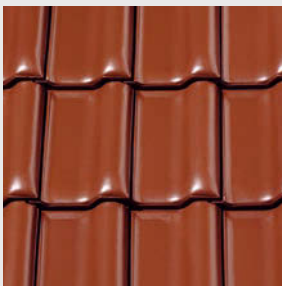
NUANCE kupferrot engobiert