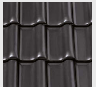
NUANCE anthrazit engobiert